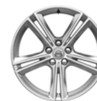
18 inch, 5 Spite Duble, Silver Bright 245/45R18