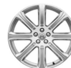
20 inch, 8 Spite, Silver Diamond Cut 255/35R20