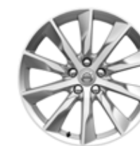
18 inch, 10 Spite, Turbine Silver Cut 245/45R18