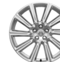
19 inch, 10 Spite, Silver Diamond Cut 255/40R19