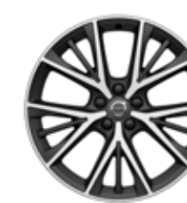
19 inch, 5 Spite, Triple Diamond/Black Cut 255/45R19