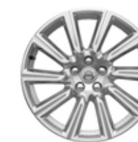
18 inch, 10 Spite, Silver Diamond Cut 245/45R18