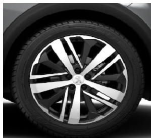
Jante aliaj 19" BOSTON (standard GT)