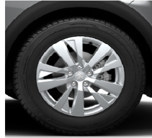
Jante aliaj 17" CHICAGO (standard ACTIVE)