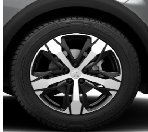
Jante aliaj 18" LOS ANGELES (cu optional Grip Control)