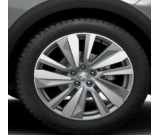
Jante aliaj 19" WASHINGTON (optional Allure / GT line)