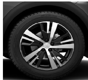
Jante aliaj 18" DETROIT matt diamond (standard GT Line)