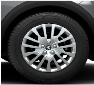
Jante tabla 17" + capace roti MIAMI (standard ACCESS)