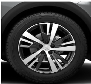
Jante aliaj 18" DETROIT (standard ALLURE)